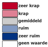
Afbeelding 2: Spanningsindicator Nederland 3e kwartaal 2024