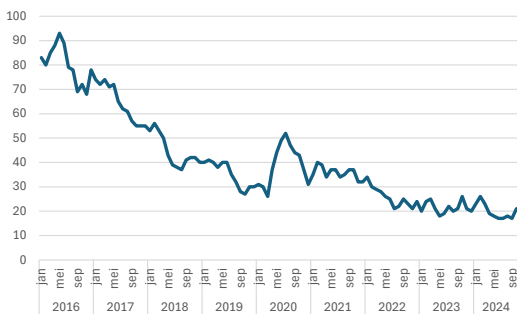
Afbeelding: ontwikkeling bezorgers met WW-uitkering Amersfoort 2018-heden

Voorals vlak na de coronaperiode steeg de vraag naar bezorgers. In de eerste helft van 2024 zien we dat de vraag wat afneemt, maar dat lijkt in lijn met dezelfde perioden in 2022 en 2023. Toen steeg de vraag met de naderende feestdagen ook in het derde en vierde kwartaal.